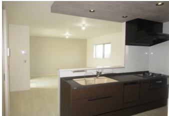
〔トクラス製システムキッチン〕