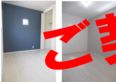
〔各部屋のアクセントクロスがいいですね〕