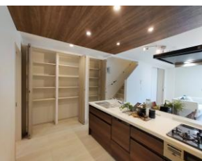
〔パントリー大収納〕