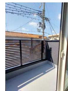
〔南向きバルコニー〕