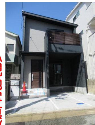
〔南向き公道5Mに面す〕