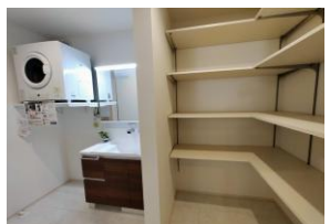
〔収納スペース多し〕